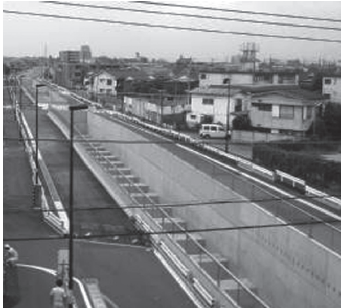
駅から石神井東小学校を望む

〒176-0021 練馬区貫井 3-53-8 Tel / Fax : 3998-1752