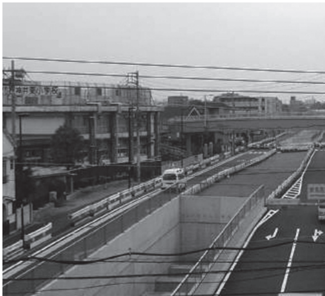
駅から目白通り方面を望む