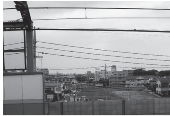
中村橋駅から目白通りを望む

千川道りから、中村橋駅の脇を通り、目白通りまでの補助二三三号線について、平成十八年度に街路築造工事・電線共同溝等工事を実施し、十九年度春に一部区間で暫定交通開放し、二十年春には全線で開通します。